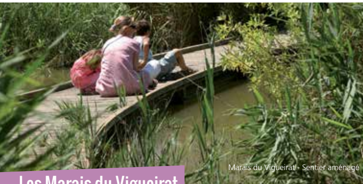
Marais du Vigueirat - Sentier aménagé

L'itinéraire croise une conduite de type gazoduc ou saumoduc qui alimente la zone industrielle et portuaire de Fos-sur-Mer. Un saumoduc est une canalisation destinée à transporter de la saumure, c'est-à-dire de l'eau salée. Les saumoducs sont généralement des canalisations industrielles, amenant la saumure depuis des lieux de production (marais salants, cavités salines, mines de sel gemme...) vers des usines de transformation.